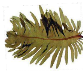
Extracto de Glicerina Wakame