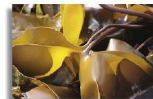
Extracto de Glicerina Laminaria Oily Extract Laminaria