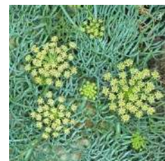
Agua de Mar Fennel Orgánico