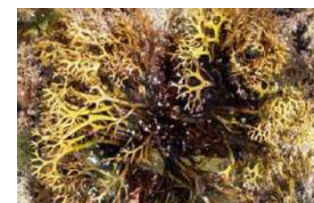
Extracto de Glicerina de Lichen