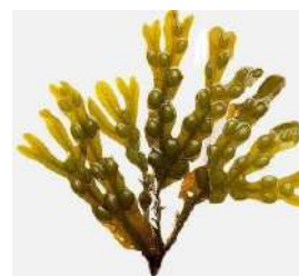
Extracto de Fucus Glicerina