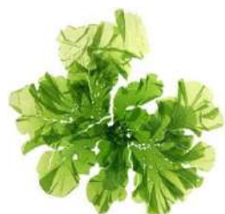
Extracto de Glicerina Ulva