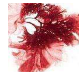
Extracto de Nori Glicerina