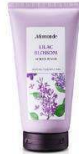
Celluloscrob Scrub Wash