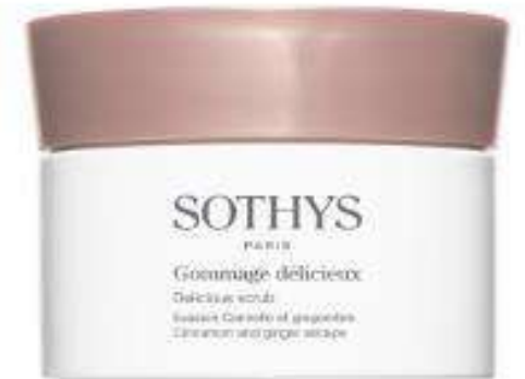
Ginger Exfoliator Body Scrub