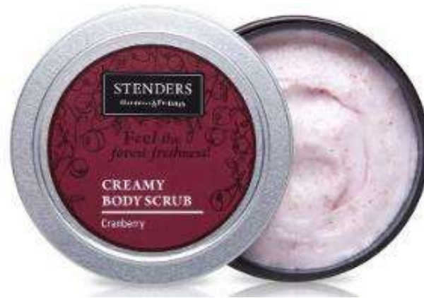
Celluloscrob Body Scrub