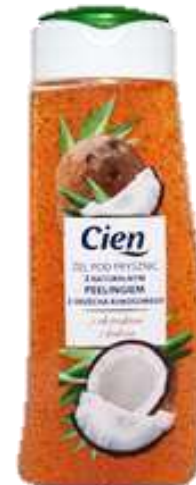
Celluloscrob Shower gel