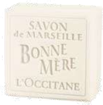
Apricot Exfoliator Soap