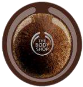
Coconut Exfoliator Body Scrub