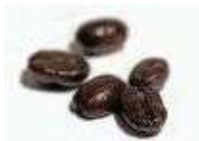
Hierbas y especias