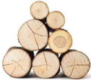
Exfoliante de celulosa