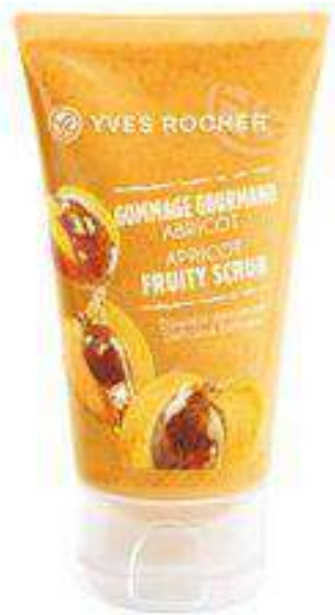
Apricot Exfoliator Facial Scrub