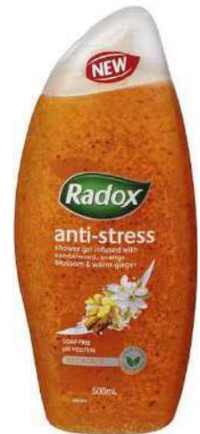
Exfoliator Shower Gel