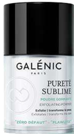
Celluloscrob Scrubing powder