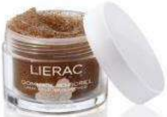
Peach Exfoliator Facial Scrub