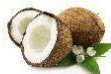
Cascaras y huesos