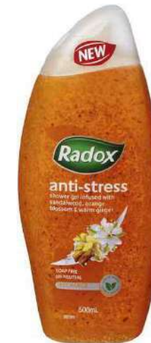
Exfoliator Shower Gel