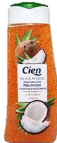
Celluloscrob Shower gel