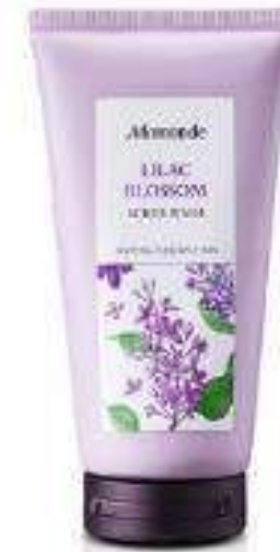
Celluloscrob Scrub Wash