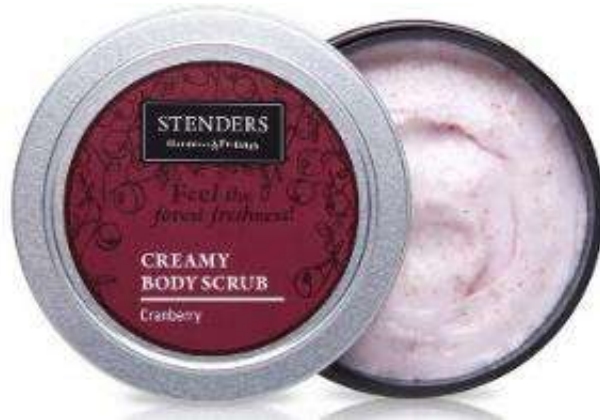
Celluloscrob Body Scrub